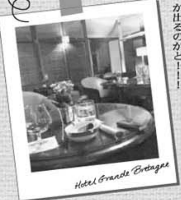
Hotel Grande Bretagne