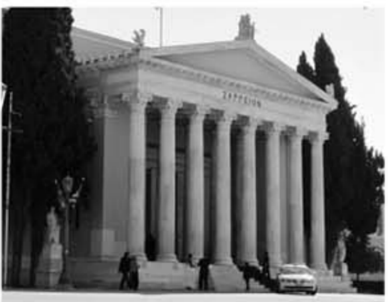
MONDE SELECTION 授賞式会場「ZAPPEION HALL」

アテネではアクロポリスの丘に上り、ギリシャの古代の遺跡を見ました。紀元前二千年三千年とかの話が次々出てきますので、その頃の日本は縄文、弥生時代？日本には歴史として記録のない時代だったかなあ？と首を傾げる位全くギリシャの歴史には不案内でした。古代ギリシャはベルシヤによって完全に破壊されたとかカイドさんは言われ、その次はローマに占領されローマの遺跡が沢山残っていることも初めて知りました。