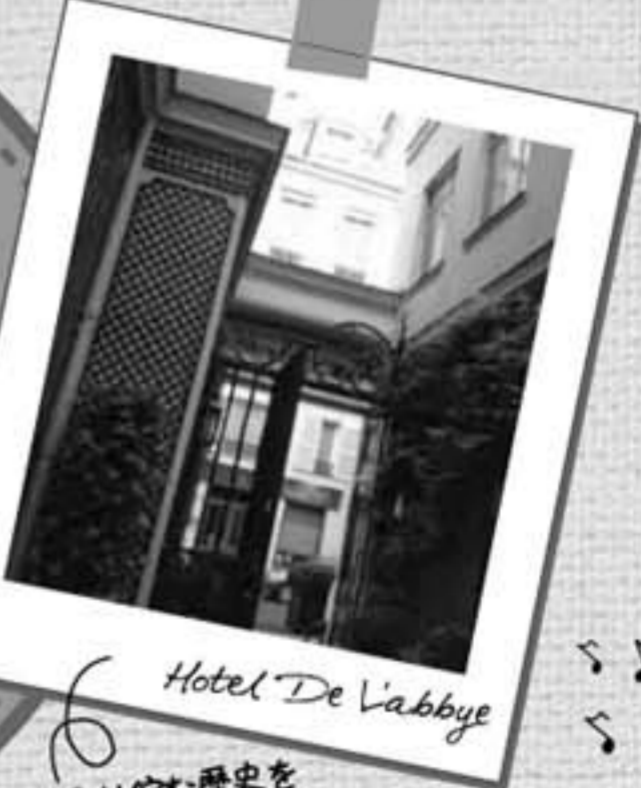
Hotel De l'abbaye こっそり佇む歴史を感じる重厚なホテル！