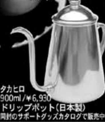
タカヒロ 900ml/¥6,930 ドリップポット(日本製) 同封のサポートグッズカタログで販売中

ドリップするにはこの作業が気持ちよく出来ない、ドリップする意味が無い、大事なことが分かって来ました。いろいろポットを試してみた結果、このポットが一番気持ちよくお湯を注げるので、皆さんにお薦めしよう、ここに参上した次第です。