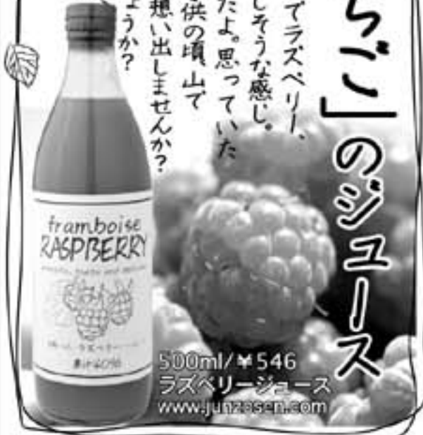
500ml/¥546 ラズベリージュース www.junzosen.com

フランス語でフランボワーズ、英語でラズベリー、なんとなくフランス語の方が美味しそうに感じ、これを少量ジュースにしてみましたよ。思っていた以上に美味しく出来上がり驚くくらい子供の頃、山で良く獲りお菓子代わりに食べたことを思い出しませんか? 七十歳以上の人でないとお通じないでしょうか? 初回は余り数も残っていませんので、ご迷惑をおかけするかもしれません。