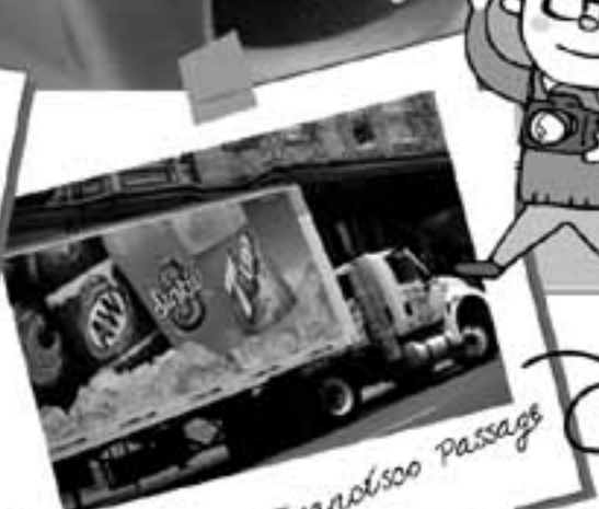
San Francisco Passage サンフランシスコの坂に止まっているトラック。日本のトラックと違って、何故かエンジンが?