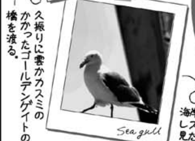
54年前も同じ橋だった! 久振りに雲かカスミのかかったゴールデンゲートの橋を渡る。 海岸べりのレストランから見たカモメさん