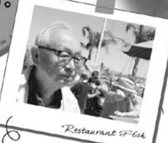
空も青く澄んでいて外で食事をするのも気持ちがいいのです! 「FISH」にて。