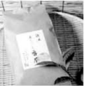
赤ちゃん番茶(300g)630円(税込) 詳しくはhttp://www.junzosen.com フリーダイヤル:0120-103-712

この番茶注文が多く驚かれています。何故なんだろう? 私も知りませんでしたので担当者尋ねてみると「カカオインやタンニンが殆ど抽出されない」 「この茶葉は二月・三月の寒い時に近江の甲賀で収穫された春番茶を使用しています。厳冬の茶葉です。害虫の発生もなく、農薬を使わず栽培されている。という事で「赤ちゃん」妊娠中の女性や「高齢者の方」病後療養中