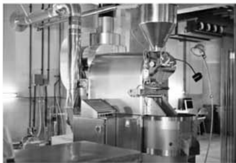
こんな大きな焙煎する機械がある店内はちょっと珍しい!