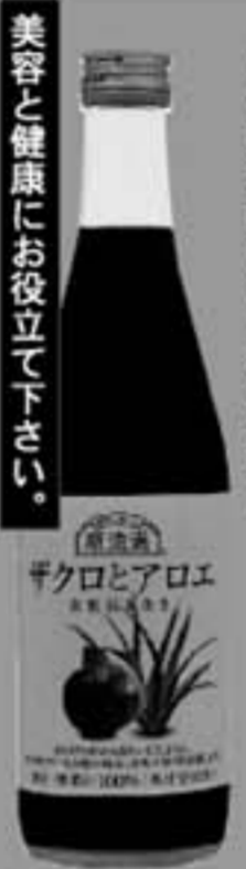
ザクロとアロエ(500ml)1本あたり893円(税込) 詳しくはhttp://www.junzosen.com フリーダイヤル:0120-103-712

ホルモンの関係で女性の人達に大人気のザクロジュースに、便秘に効果のあるアロエをミックスしたジュースを作ってみました。 アロエだけでは飲み難いのでザクロを混ぜ飲み易くし、一挙両得のジュースです。なんか効きそうなきがしています。一度この効果を試されませんか。 美容と健康にお役立て下さい。