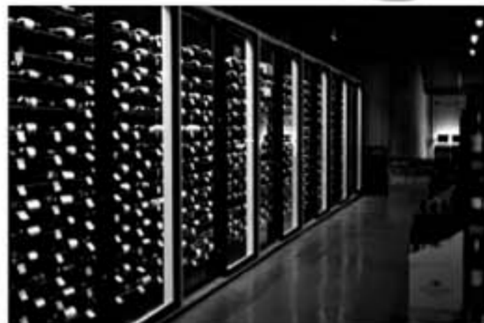
約1700アイテムのワインが並び店内は圧巻! 1000円以下の手頃なワインから100万円級の超高級ワインまで幅広く取揃えている。

New SHOP!!! 新しい店ができました! ワインとコーヒーのお店 タカムラ 写真のような大きなコーヒーを焙煎する機械を設置し、コーヒーを焙煎しながら美味しいコーヒー豆を提供するお店です。お店でも飲みます。また写真のようにワインを楽しめるワインの売り場もあります。コーヒーとワインが一体となったお店は日本でも初めてではないかと思えます。面白い、楽しい店ですよ。是非一度御覧ください。面白い、楽しい店ですよ。