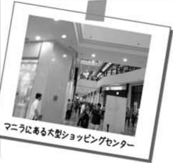
マニラにある大型ショッピングセンター

新聞でフライリピン経済が好調で株式市場も活況を呈している等、フライリピンについての良いニュースを最近多く聞き、一体どのような状況なのだろうと知りたくなり二泊三日で出張しました。予測していたフライリピンというか、マニラとは大分違うように見え認識を新たにしています。 一、マニラ及び田舎の方にも出掛けました。予想以上に治安は良く「危ない、用心しないと」という感じはなかった。 二、仕事の関係で地方に行きましても貧しくはありませんが、働いている人々は人としての柔らかさと人間味があり、気持ち良く接することができ、中国とは大分違うなあと感じたことでした。 三、資本がないので設備機械に投資ができません。どうしても手作業というがHAND MADE的な商品作りになるような気がします。外国資本導入が不足しています。 四、マニラは不動産バブルの様相でここでもかあーという思いでした。