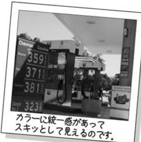
カラーに統一感あってスキッと見えるのです。

ロサンゼルスに出かけ、魚料理が食べたくなり、サンタモニカ近くのこのレストランに初めて行ったのですが、店の前に立った時、入口上のネオンサインのデザインが美しく、iPhoneで写真を撮りました。