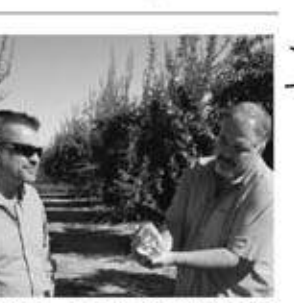
美味い!日本のザクロとは全く違います。収穫期の十月頃になりますと、この畑から日に大きなジャンボタンブカーのようなトラックで○○台分のザクロが洗果、選別工場

順造選ザクロジュースのザクロの旅の話をしましょう。ザクロを栽培している会社がロサンゼルス、サンタモニカ空港から四人乗りの単発プロペラ機(自家用小型機)で四十分位の所のザクロの畑まで連れて行ってくれます。飛行機の上から見ると大きな砂漠のような光景が拡がり、その