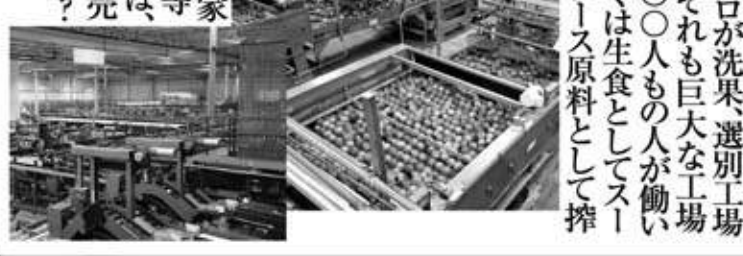
を支配して、効率化等夢のまた夢の農業では、世界市場の中でどう売っていくのでしょうか?不思議です。

「運ばれるのです。それも巨大な工場に最盛期には三、〇〇〇人も人が働いていますよ。その多くは生食としてスーパーで売られ、部ジュース原料として搾汁されます。アメリカの大規模農業は会社が経営している、とにかく農業の規模が違うのです。日本の農業は個人が中心で、会社としては出来ないのですから食を世界にと