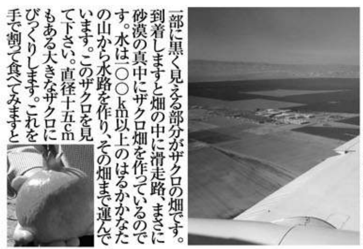
一部に黒く見える部分がザクロの畑です。到着しますと畑の中に滑走路、まさに砂漠の真中にザクロ畑を作っているのです。水は○○km以上のはるかかなたの山から水路を作り、その畑まで運んでいます。このザクロを見てください。直径十五cmもある大きなザクロにびくびくします。これを手で割って食べてみますと

【Aタイプ】リーデルヴィノムボルドーワイングラス 6,048円(税込) 【Bタイプ】リーデルヴィノムブルゴーニュワイングラス 6,048円(税込) 2倍位、美味しく感じられると思ひますよ。一度お試しあれ!