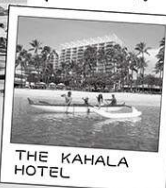
THE KAHALA HOTEL

ホノルルは私にとって忘れることのできない最も重要な場所の一つです。ホノルルの常宿 THE KAHALA HOTEL については昨年6月号に一寸書きました。