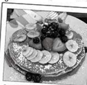
Sweet E's Cafeのフルーツたっぷり!パンケーキ

「SWEET E'S CAFE」 このPANCAKEを見て下さい!! 大きくて、豪華でビックリ!! PANCAKEにADD FRUITS と言いますと出て来ます。