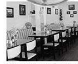
カジュアルなお店です!

「SWEET E'S CAFE」 このPANCAKEを見て下さい!! 大きくて、豪華でビックリ!! PANCAKEにADD FRUITS と言いますと出て来ます。