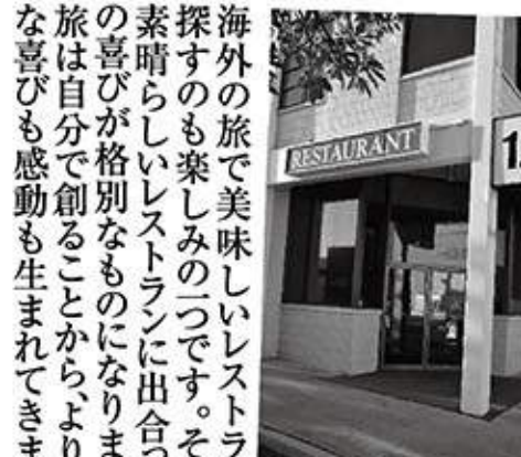
新鮮な地元食材を活かした隠れた名店 12th AVE GRILL

この近くに「マラサダス」(揚げパン)で有名なLEONARDS BAKERYがあります。夕食はカイクキにありますがニューアメリカン料理が美味しい「12th AVE GRILL」でチヨイチヨイ食べます。値段もそう高くなく、お奨めの店です。