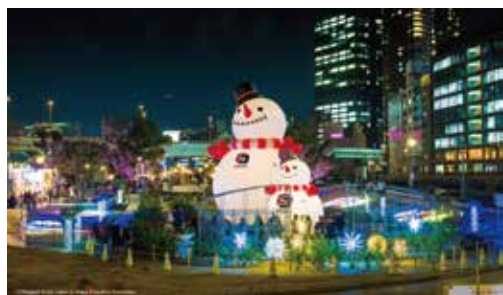
中之島公園バラ園(東側)のスノーマンパーク。