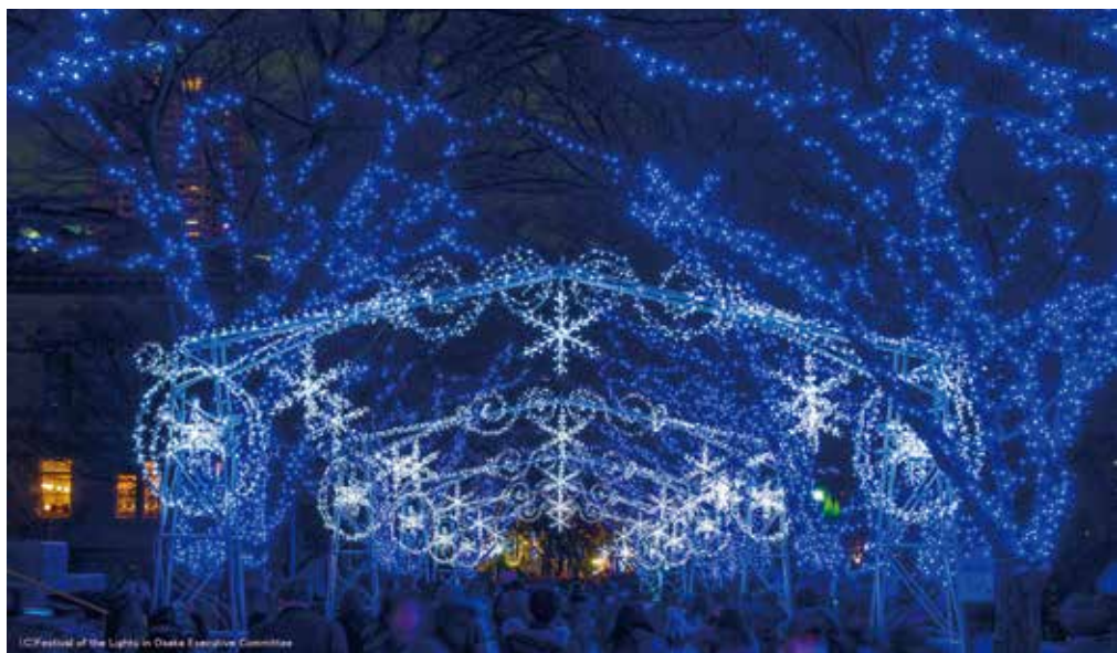
大阪市役所南側の全長約150mのケヤキ並木にかかる光のアーチ。

16年目となるOSAKA光のルネサンスは中之島に広がる水辺の風景を活かしたイルミネーションや大阪市中央公会堂に映し出される プロジェクトマッピングが楽しめます！今年で開館100周年を迎える大阪市中央公会堂とのコラボレーションは期待大です！