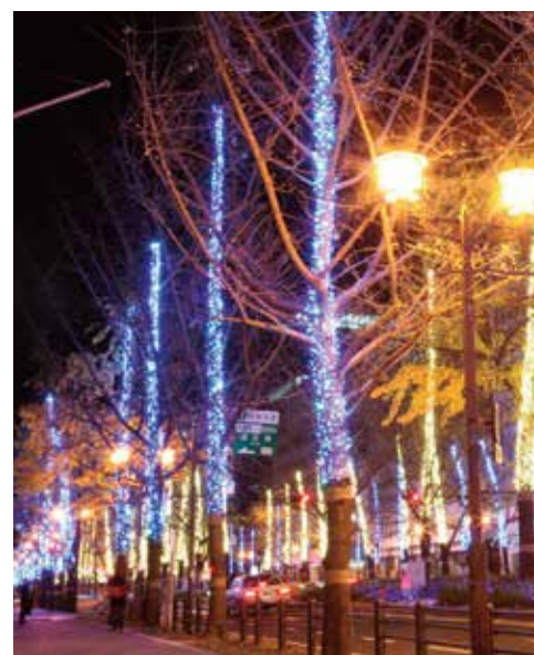
御堂筋イルミネーション 2018 2018/11/4(日)～12/31(月)(58日間) ▽17:00頃～23:00▽御堂筋(阪神前交差点～難波西口交差点)

御堂筋はフランスのシャンゼリゼ通りを手本として作られた梅田・本町・心齋橋・難波を結ぶ、全長4キロ、幅44メートルの銀杏並木の続く大阪のメインストリートです。冬になると、この銀杏の木に数え切れ ないほどのLEDライトが設置され、美しい光の通りへと変身するのです。なんと、2015年にはあのギネス世界記録に「最も多く街路樹にイルミネーションを施した通り」として認定されているのですよ！