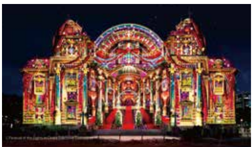
大阪市中央公会堂をスクリーンにしたプロジェクトマッピング。